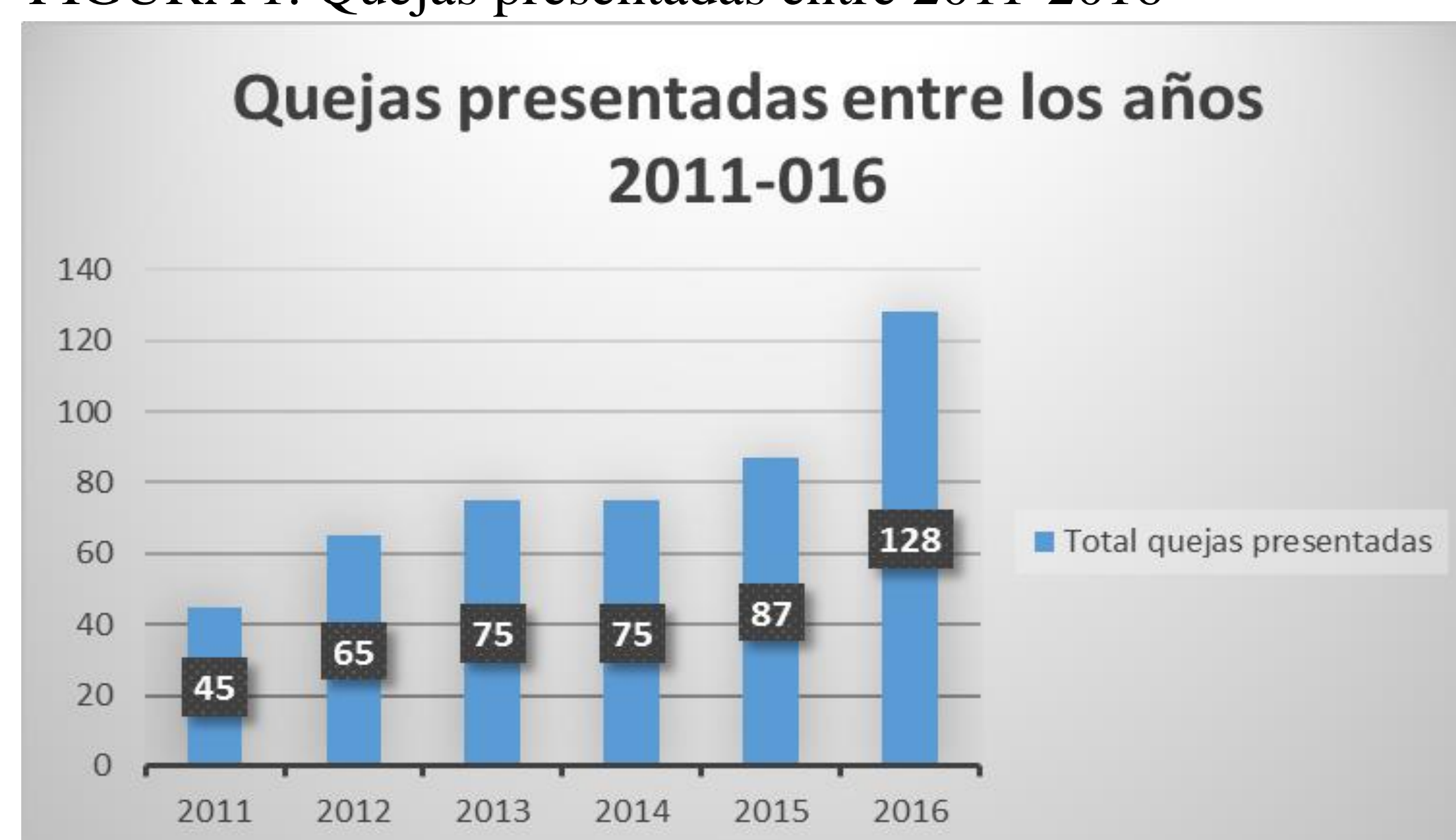
FIGURA 1. Quejas presentadas entre 2011-2016

Los datos obtenidos indican un aumento en relación a las quejas interpuestas a los colegiados.