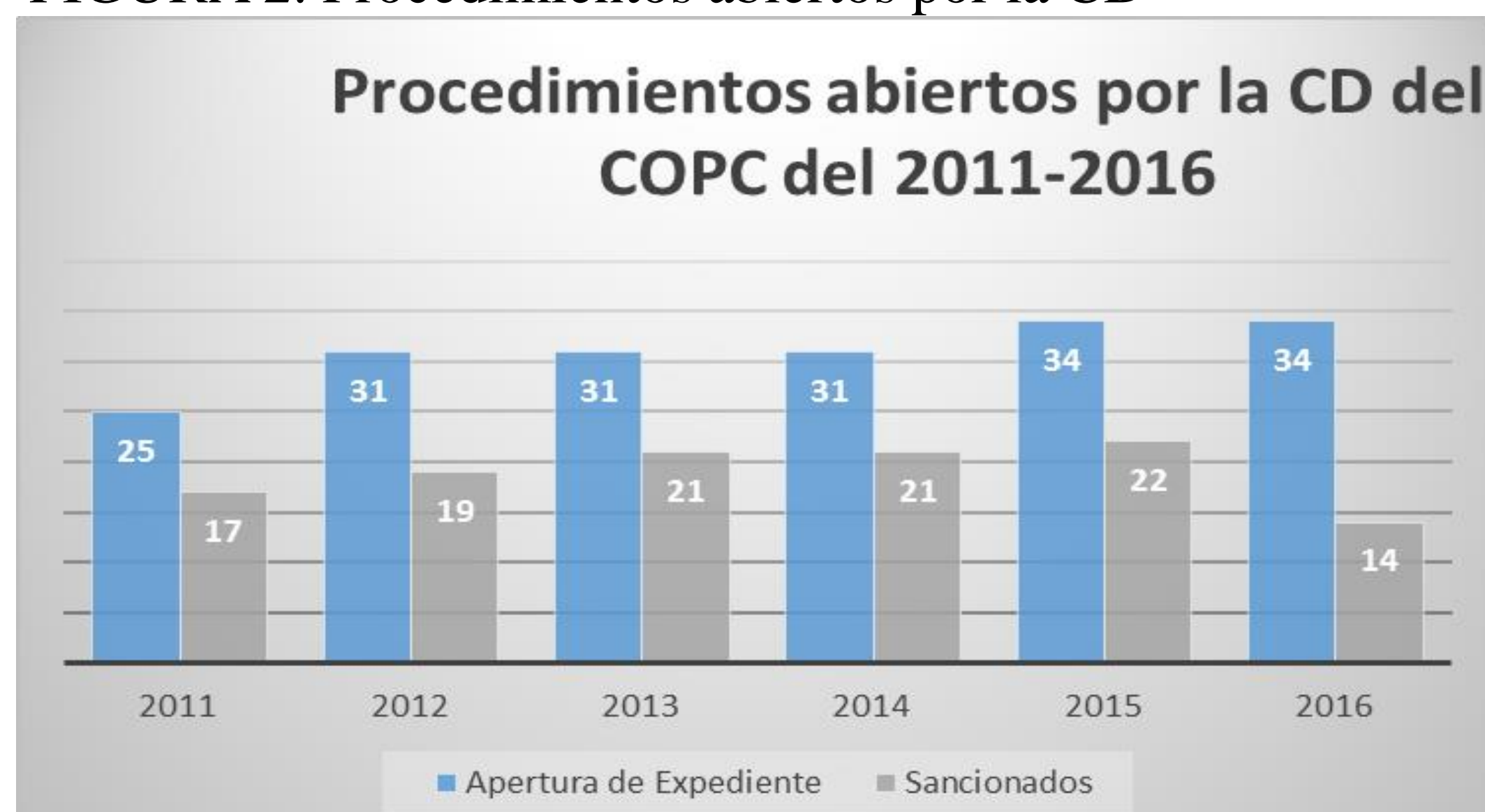
FIGURA 2. Procedimientos abiertos por la CD

Asimismo, se observa en la Figura 2, un aumento en el número de sanciones, a pesar de que los colegiados realizan más consultas a la Comisión.