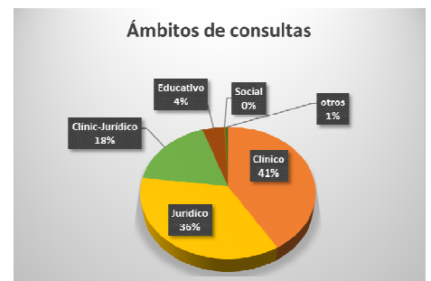
FIGURA 2. Ámbitos de infanto-juvenil consultados (2015-2017)