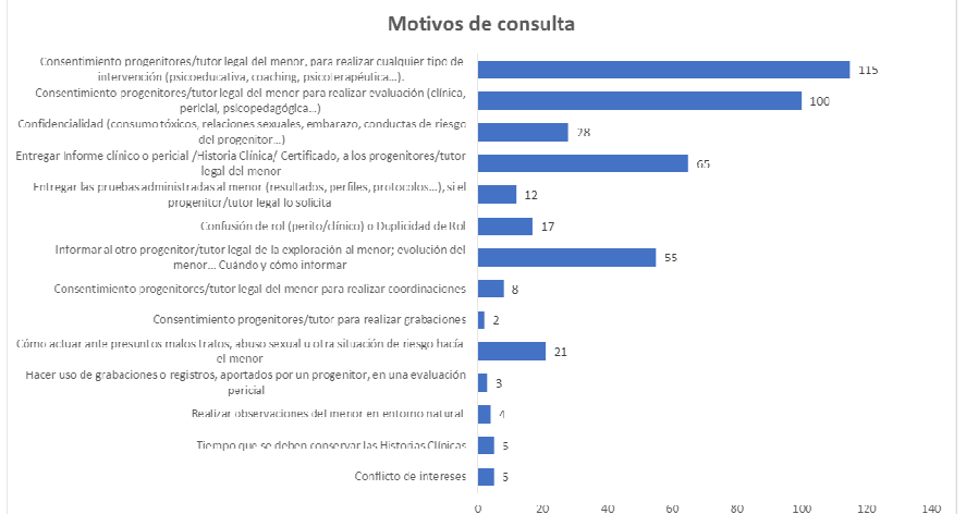
FIGURA 3. Motivos de consulta del área infanto-juvenil (2015-2017)